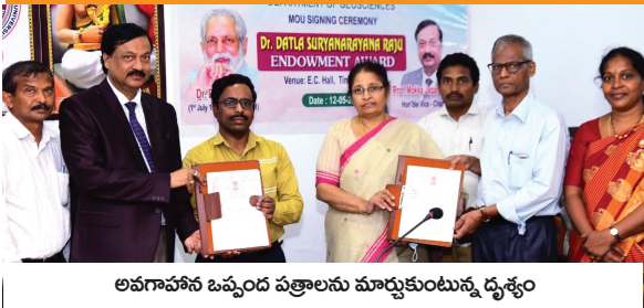
అవగాహన ఒప్పంద పత్రాలను మార్చుకుంటున్న దృశ్యం