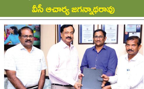
సహస్రాబ్ది ప్రతిపాదనను వీసీకి అందజేస్తున్న దృశ్యం